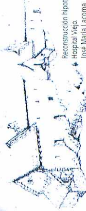
Reconstrucción hipotética del Hospital Viejo. José María Lacoma

Viajeros, comerciantes y soldados han dejado asimismo su huella en este enclave fronterizo de importancia estratégica. Entre los episodios bélicos que ha presenciado destaca la persecución de los "maquis", rebeldes armados contra los que, en la década de 1940, se creó una red de trincheras y puestos de vigilancia. Mucho más prolongada y azarosa fue la existencia del Hospital de Benasque, creado en época medieval como establecimiento de apoyo a quienes cruzaban los puertos de montaña.