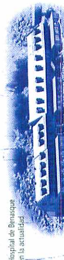
Hospital de Benasque en la actualidad

Viagers, comerciantes y soldats han dixau tabé la suya impronta a isto estratéegico puesto de frontera. Entre les fetes de guerra que ha visto, sobresall la persecución dels maquis, rebeldes armats contra els que se va fer els ans 40 una ret de trincheres y puestos de vigilancia. Molto més duradera y azarosa va estar la existencia de l'Hospital de Benàs, fetu en època medieval coma punt de apoyo tals que crusaven els puertos.