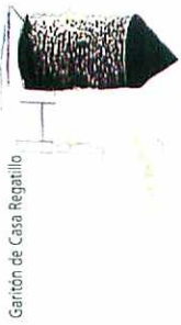
Garfallo de Casa Regatillo

Durante la segunda mitad del siglo XVI, Benasque logró una cierta bonanza económica pero al mismo tiempo sufrió los efectos del bandolerismo y de una auténtica guerra civil en el Condado de Ribagorza. De todo ello surgió un tipo muy particular de vivienda noble denominada casa torreada, que tomó como modelo las torres-castillo medievales. Tiempo después, cuando ya no hubo necesidad real de protección, este tipo de torre sirvió asimismo para dar una impresión de poder y prestigio.